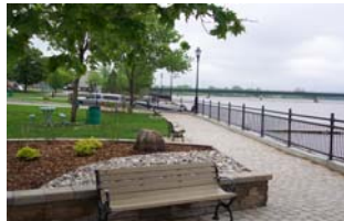
Aménagement de la Promenade Paul-Sauvé